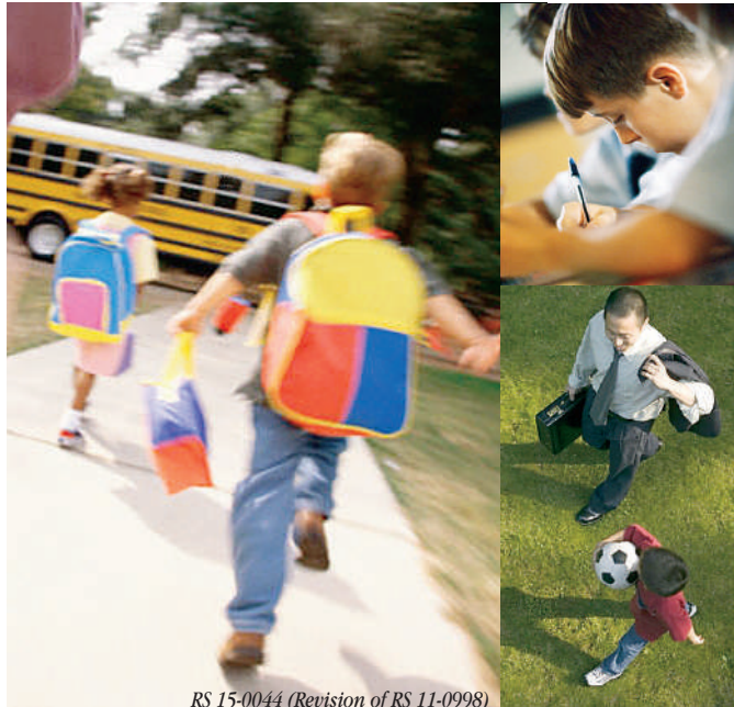
RS 15-0044 (Revision of RS 11-0998)

If your child is having trouble learning, he or she does not have to face it alone. Operation Search can help! If your child has a difficult time learning, speaking, moving or getting along with others, there are skilled professionals who can help. Operation Search helps identify children with disabilities ages 0 to 22. If you think your child may benefit from specially designed instruction, please call us. We are here to help.